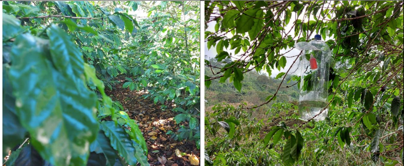
Entrega de material para el trapeo de la broca del café.