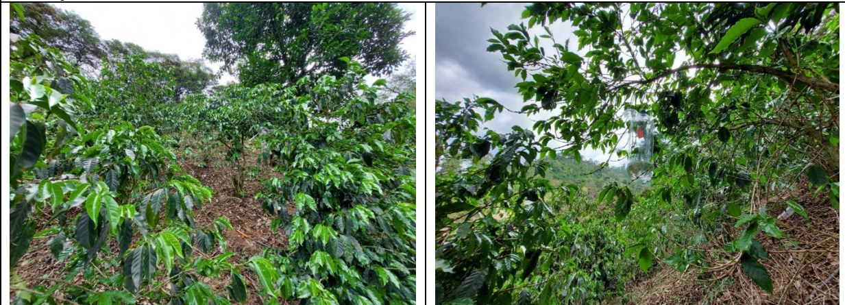
Trampeo de Broca del café.