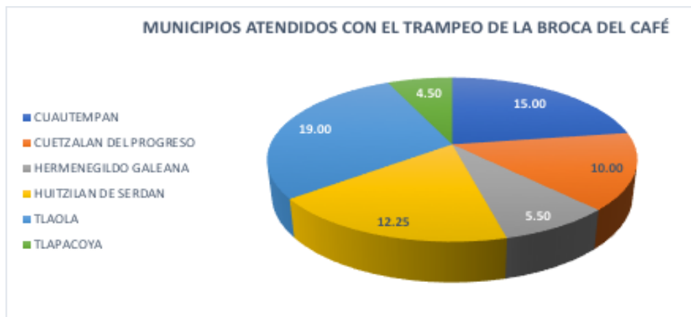
Figura 1. Superficie atendida con Trampeo de la Broca del Café por Municipio